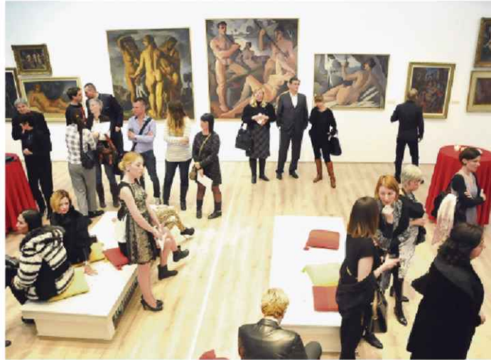
Гала вече организовали Колор прес група и Галерија Матице српске